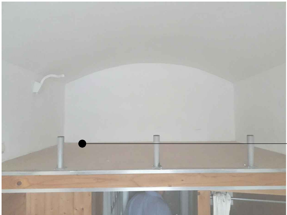
SOBA 106. -izdelati lestev iz ALU profilov 40/40mm do višine cca. 2m -izdelati varovalno ograjo vzdolž ležalca iz alu cevi fi 40mm, ki se jo vgradi nad obstoječe vertikalne elemente -investitor uskladi predlog izvedbe uvažajka z avtorsko skupino

Vgrajena konvektorji v celici Naprava za ogrevanje POSREDE KONVEKTORJEV DO INFORMATIVNE DOKONČNE ODLUČITI NA MESTU Celotni nadstropni prostor se avtorsko ureja. Investitor bo za posrpe preloži soglasje zobratel določi se obliko preložitve. Izvajalec mora pred začetkom dela v posamezni etni izdelati varovalne elemente. Zato mora biti izdelana z elementi, ki so priloženi v celici. Vse elemente izdelati in priložiti v celici. Izvajalec mora pred začetkom dela v posamezni etni izdelati varovalne elemente. Zato mora biti izdelana z elementi, ki so priloženi v celici. Vse elemente izdelati in priložiti v celici. Izvajalec mora pred začetkom dela v posamezni etni izdelati varovalne elemente. Zato mora biti izdelana z elementi, ki so priloženi v celici. Vse elemente izdelati in priložiti v celici.