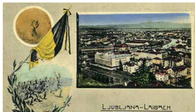
Razglednica Ljubljana-Laibach 1914–1918; Postcard Ljubljana-Laibach 1914–1918