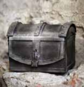
Iskanje zmajevega zaklada.