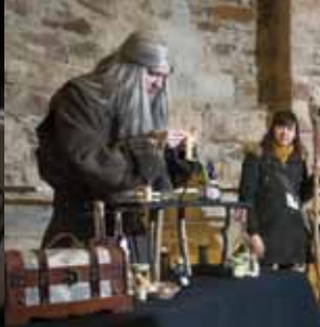
Skrivnostni svet zmajev.