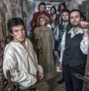
Izza grajskih rešetk.