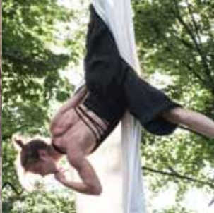
Ples na zračnih tkaninah.