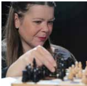
Beli in črni kralj.