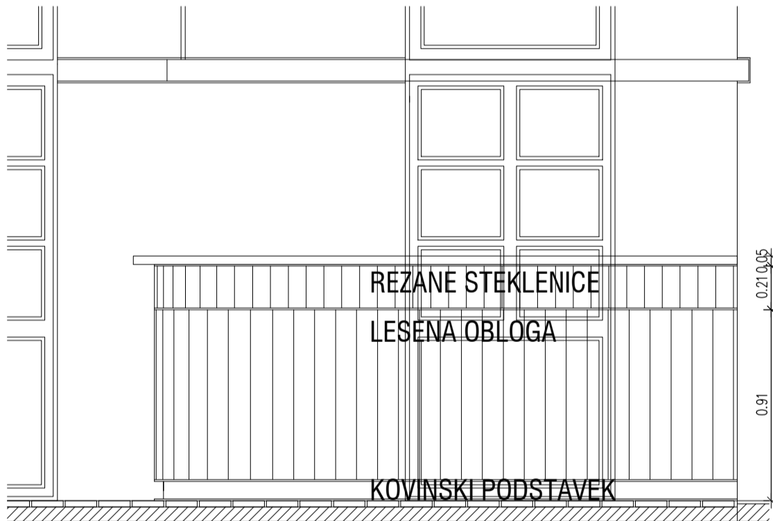
POGLED TOČILNI PULT