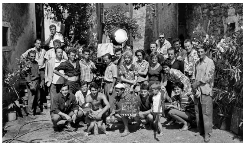
Skupinski posnetek filmske ekipe in igralcev filma Tistega lepega dne, Podnanos, julij 1962. Group shot of the film crew and actors from the film That Beautiful Day (France Stiglic, 1962). Podnanos, July 1962.

Who does not know the evergreen Slovenian films, such as Na svoji zemlji, Dobro morje, Ne čakaj na maj or Srečno, Kekec?! From 19 April, the "S" Gallery will host an exhibition of selected works by photographic master Božo Štajer (1910–1967), taken between 1948 and 1963, when he collaborated with Triglav Film and Viba Film as a theatre photographer. Visitors will have an opportunity to view selected photographs taken during the filming and behind the scenes of eight Slovenian films made between 1948 and 1963.